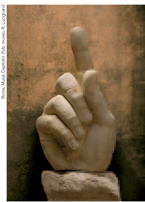
Roma, Musei Capitolini