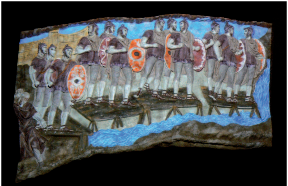
Restauro virtuale della Colonna Traiana presentato a Restauro 2008